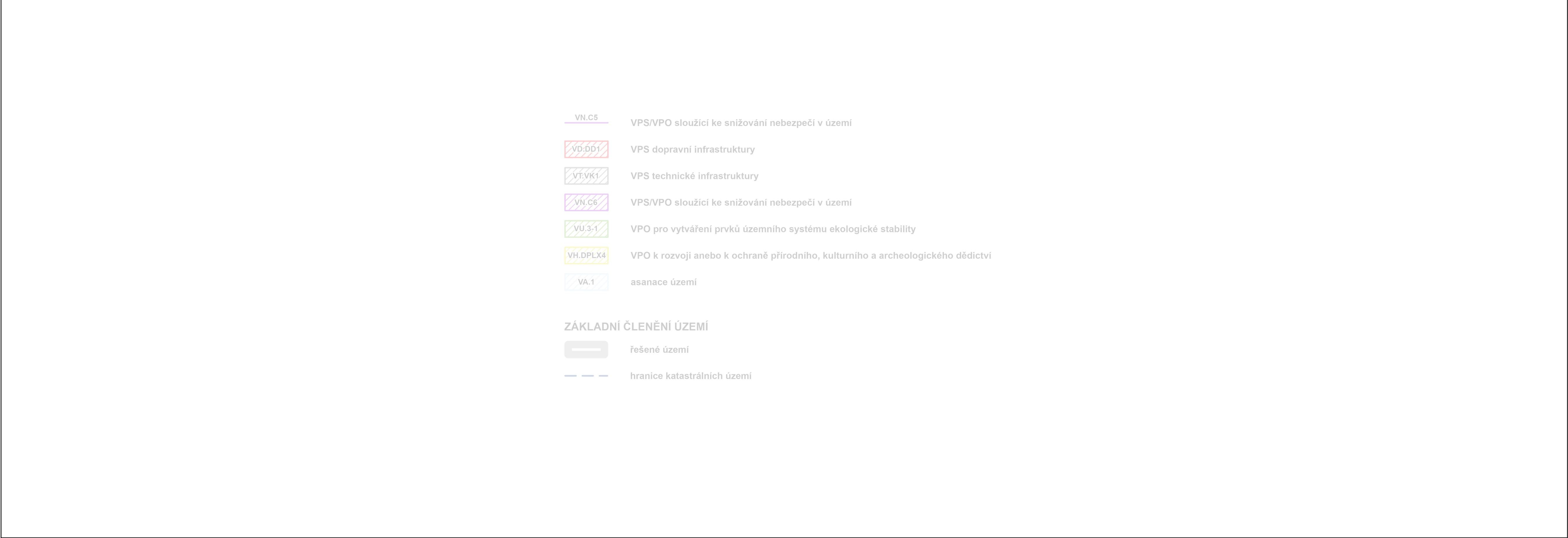
KLAD MAPOVÝCH LISTŮ